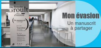
Mon évasion Un manuscrit à partager