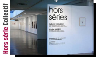
Hors série Collectif