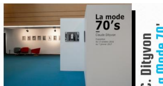
C. Dityvon La Mode 70'