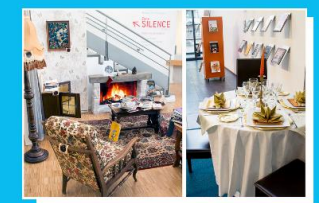
Valorisation Noël 2016