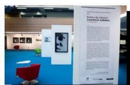
L. Leblanc Bulles de silence