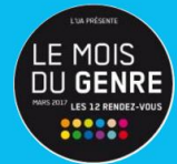
LE MOIS DU GENRE