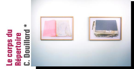
Le corps du Répertoire C. Douillard * résidence au Centre des Archives Féminisme