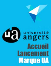
Université Angers Accueil Lancement Marque UA