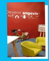
JPO | Infocampus Saint Serge