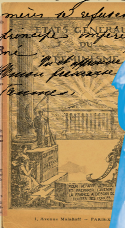
Photographie centrale © Béatrice Lagarde, 1982.