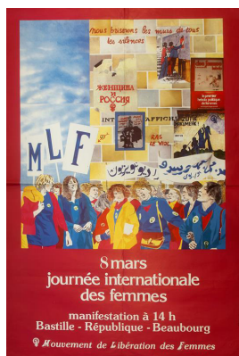
Mouvement de libération des femmes, le 8 mars 1980 dans le cadre de la journée internationale des femmes