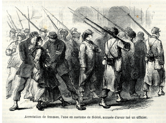
Arrestation de femmes, l'une en costume de fédéré, accusée d'avoir tué un officier, mai 1871. Dans L'Illustration , 1871. Coll. Musée de l'Histoire vivante – Montreuil