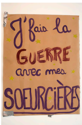
Auteur : Gang de meufs podcast Université d'Angers, Centre des Archives du Féminisme

préfecture de Police de Paris, et des fonds d'archives départementales du Nord à la Gironde, en passant par le Rhône. Des vidéos et des sons proviennent du Centre audiovisuel Simone de Beauvoir et de l'Institut national de l'audiovisuel (INA).