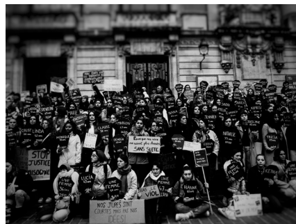
Manifestation à Lille, mars 2022.