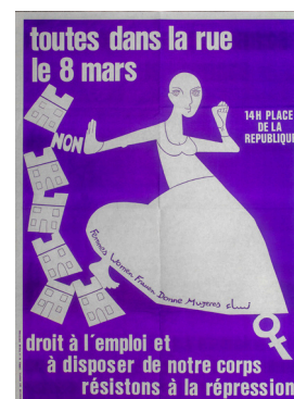
"Toutes dans la rue le 8 mars"