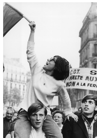
Manifestation à l'appel de la CGT. 1968.

La dimension internationale est présente à travers des œuvres évoquant l'universalité de nombreux combats à travers le monde. Une articulation entre les mouvements en France et à l'étranger permet d'éclairer tout un pan de la solidarité internationale des femmes : savoir-faire, échanges, partages et inspirations.