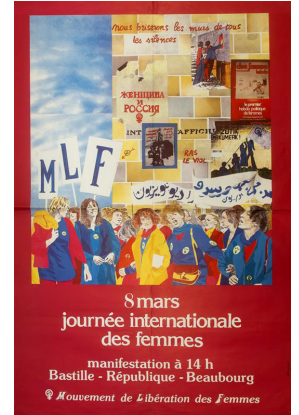
Mouvement de libération des femmes, le 8 mars 1980 dans le cadre de la journée internationale des femmes.