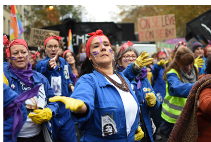
Manifestation #NousToutes à Paris, 20 novembre 2021.