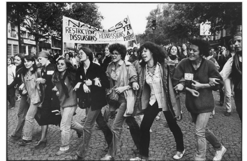
Marche des femmes en faveur de l'avortement, 6 octobre 1979.