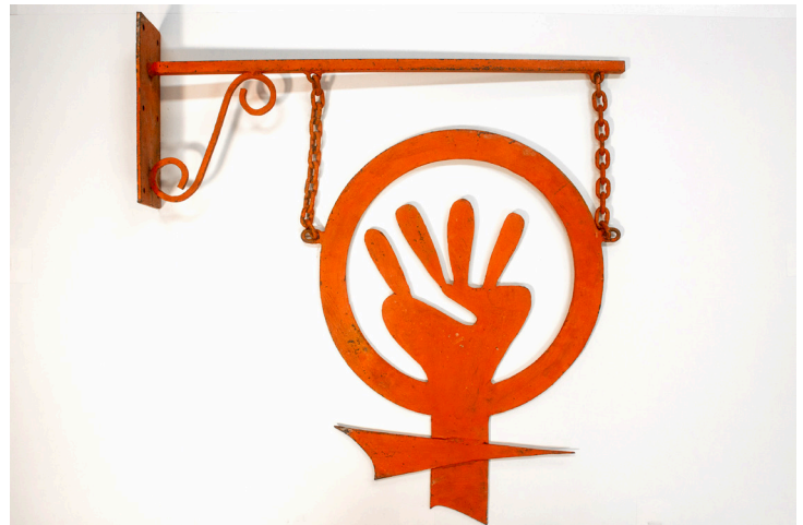
Enseigne féministe. Du Côté des femmes, Lille, années 1970. Don Association Chez Violette, récolte féministe (AFéMuse, Centre audiovisuel Simone de Beauvoir et Archives du féminisme)