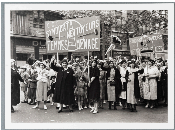
Cortège du Front populaire : défilé du syndicat CGT des femmes de ménage et laveurs de carreaux à Paris, 14 juillet 1936.