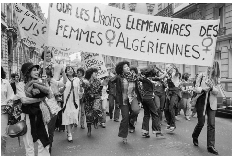
Manifestation à Paris du 1 er juillet 1978.