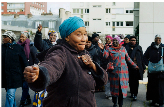
« Frotter frotter, il faut payer ! » : piquet de grève des femmes de chambre à l'hôtel Ibis Batignolles, 20 février 2020

Un espace de médiation conclut l'exposition. Le public peut y appréhender la prise de la rue au temps des révolutions et barricades, participer à une œuvre collaborative en imaginant slogans et pancartes à brandir, ou encore découvrir les figures majeures de cette longue et riche histoire qu'est l'émancipation des femmes.