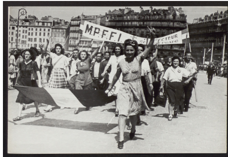
Défilé de la Libération à Marseille, quartier du Vieux-Port, août 1944.