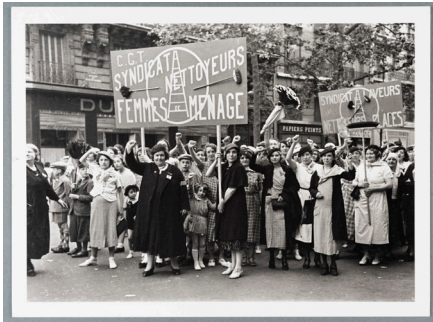
Cortège du Front populaire : défilé du syndicat CGT des femmes de ménage et laveurs de carreaux à Paris, 14 juillet 1936.