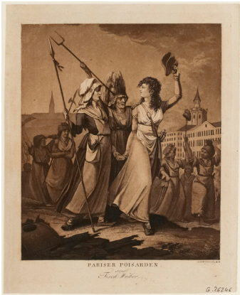
Dames de la Halle en marche pour Versailles, le matin du 5 octobre 1789. G.26246 / CCO Paris Musées / Musée Carnavalet – Histoire de Paris