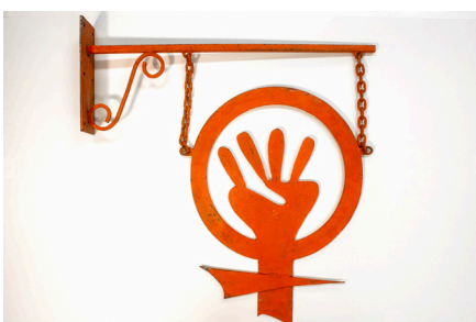
Enseigne féministe. Du Côté des femmes, Lille, années 1970. Don Association Chez Violette, récolte féministe (AFéMuse, Centre audiovisuel Simone de Beauvoir et Archives du féminisme)