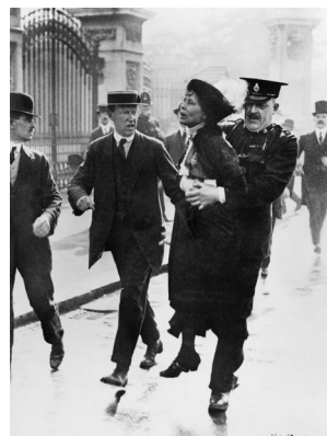
Emmeline Pankhurst (1858-1928), suffragette britannique, arrêtée pendant une manifestation. 1914.

À l'image de la Marche mondiale des femmes en 2000, les mobilisations prennent une dimension de plus en plus internationale. Elles montrent des féministes toujours plus actives et déterminées. Plus que jamais, les luttes se font écho d'un bout à l'autre de la planète et sont sources d'inspiration mutuelle. La parole se libère sur le harcèlement, les violences sexistes et sexuelles et les féminicides, avec la vague #MeToo. Des manifestations ont lieu pour l'égalité salariale et