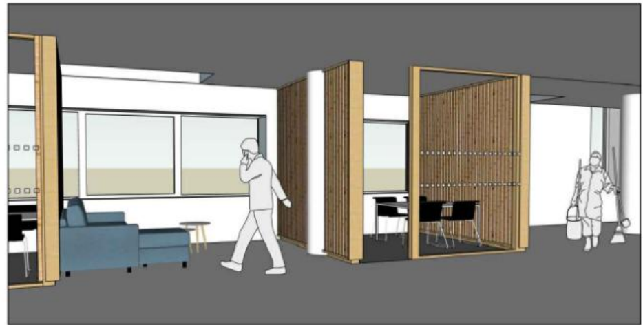
BU Belle-Beille Schéma de détail espaces de groupe zone Côté fac et panneaux acoustiques